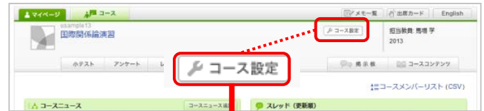
コースストップ画面

「コースメンバー(担当教員・履修生)も表示」をクリックすると、担当教員や履修生の登録メンバーも確認することができます。