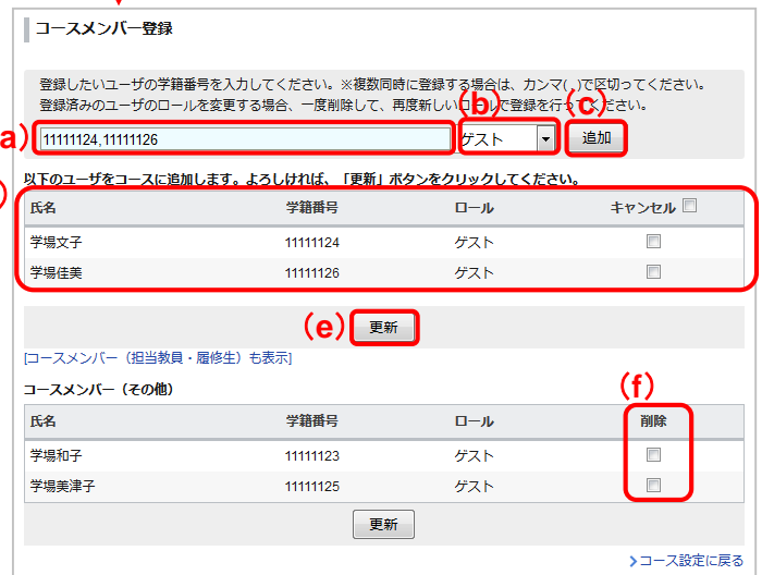
コースメンバー登録画面