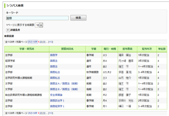
シラバス検索画面