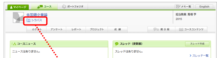
コーストップ画面

自分の登録されているコースでシラバスが公開されている場合、コースのトップ画面からシラバスを見ることができます。コース名下の[シラバス]をクリックしてください。そのコースのシラバス画面が開きます。